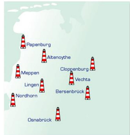
An diesen Orten sind unsere Werkstätten

Werkstätten für behinderte Menschen stellen ganz verschiedene Sachen her. Sie bieten auch Dienst-Leistungen an. Menschen mit Behinderung bekommen dadurch gute Arbeits-Plätze. Das alles möchten wir Ihnen auf diesen Seiten zeigen.